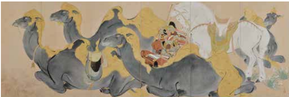
川端龍子《源義経(ジンギスカン)》 1938年、大田区立龍子記念館蔵