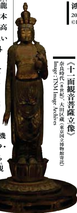
《十一面観音菩薩立像》

奈良時代(8世紀)、大田区蔵(東京国立博物館寄託)