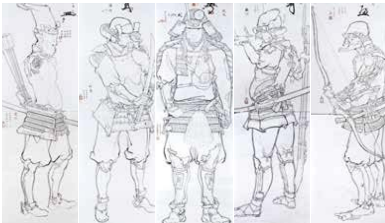
山口晃《五武人圖》 2003年、高橋龍太郎コレクション蔵

奈良時代(8世紀)、大田区蔵(東京国立博物館寄託)