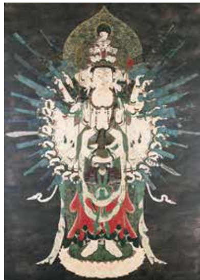
天明屋尚《ネオ千手観音》