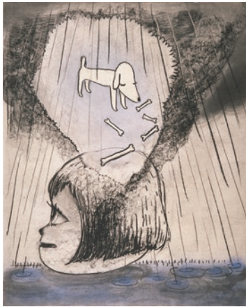
奈良美智《Rainy Day》 2002年、高橋龍太郎コレクション ©NARA Yoshitomo, Courtesy of Yoshitomo Nara