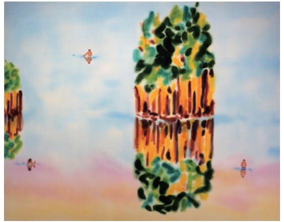
丸山直文《Island of Mirror》 2007年、高橋龍太郎コレクション