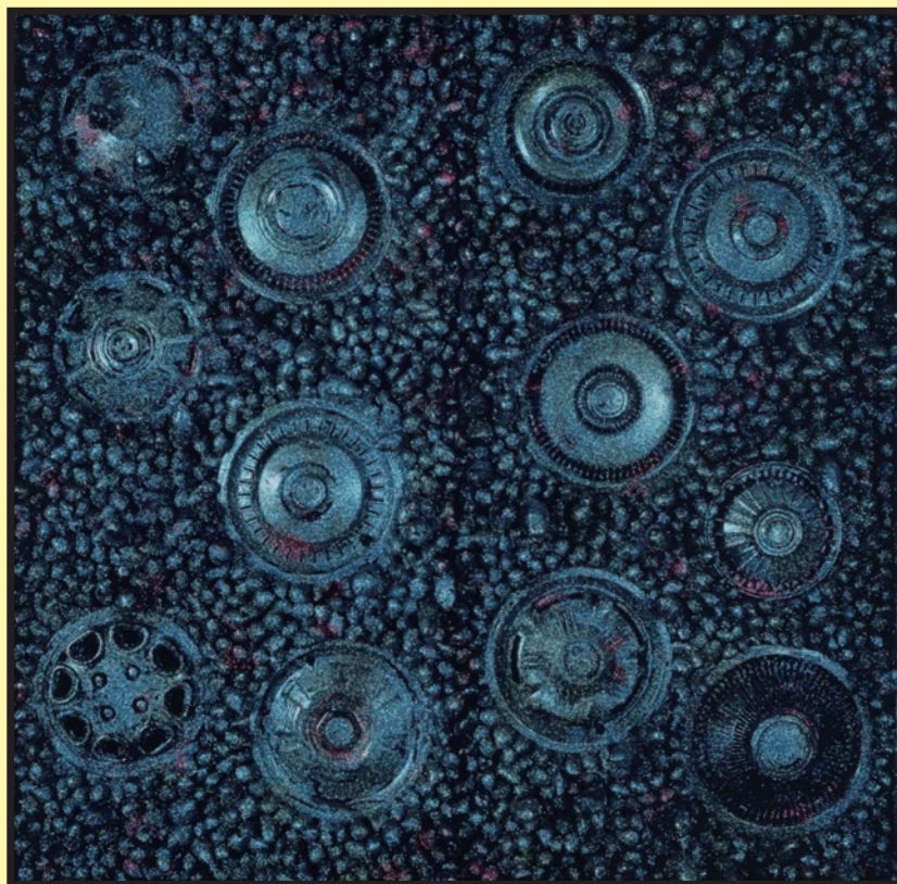
草間彌生《海底》 1983年、高橋龍太郎コレクション蔵 © YAOIKUSAMA

Kawabata Ryushi (1885-1966) is considered one of the great masters of modern Japanese-style painting. The Ryushi Memorial Museum was planned and designed by Ryushi himself and has a collection of more than 140 of his diverse works.