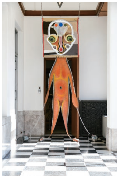
加藤泉《United》 2020年、高橋龍太郎コレクション 撮影：佐藤祐介 ©2020 Yuumi Kato 展示風景(東京都庭園美術館 2020年)