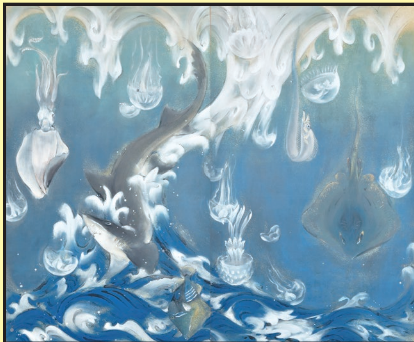
川端龍子《龍巻》 1933年、大田区立龍子記念館蔵