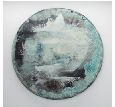
目[mé]《アクリルガス T-1#19》 2019年、高橋龍太郎コレクション