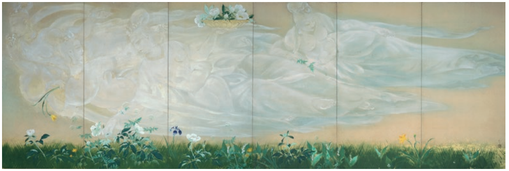
川端龍子《花摘雲》1940年、大田区立龍子記念館蔵