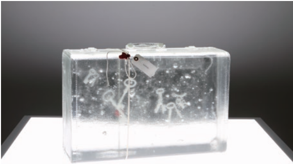
宮永愛子《suitcase-key-》 2013年、高橋龍太郎コレクション 撮影：宮島径 ©MIYANAGA Aiko, Courtesy of Mizuma Art Gallery