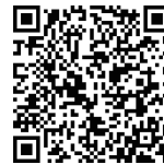
大田区文化振興協会 YouTubeチャンネル