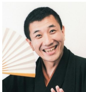
(ゲスト) 三遊亭兼好