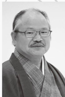
あべりゅうたろう 安部龍太郎 (作家)