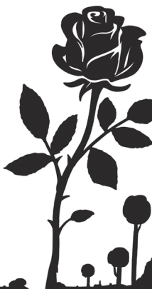
キャラクターソリスト 佐藤史哉 Sato Fumiya