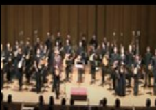
東京プレクトラムオーケストラ